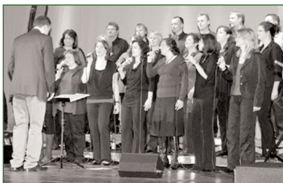
reNEWed-Konzert in Bad Hersfeld