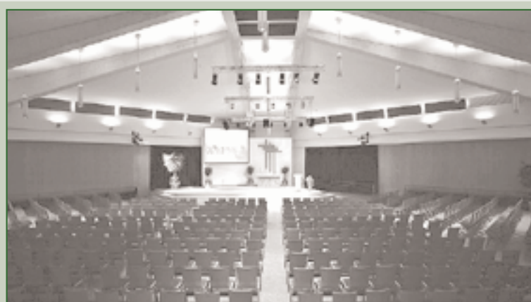
♥-lich Willkommen in der Evangeliumshalle Wehrda. Die Evangeliumshalle, die 2008 saniert wurde, erhielt eine neue, moderne Beleuchtungs- und Beschallungsanlage. Der Versammlungsraum verfügt über 500 Sitzplätze und vier Nebenhallen, so dass bis zu 1800 Personen Platz finden.

Es grüßt Sie herzlich das Vorbereitungsteam des RV Hinterland